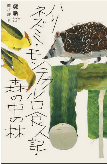
装画：朝光ワカコ / 装丁：アルビレオ